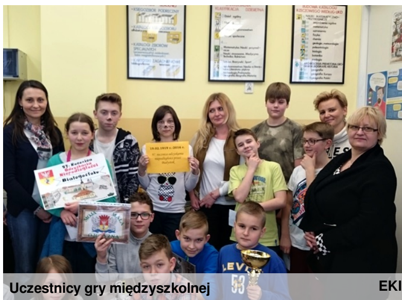
Uczestnicy gry międzyszkolnej

Counter-Strike: Global Offensive. Dlaczego ta gra jest tak popularna wśród męskiej części naszej szkoły? Str. 4