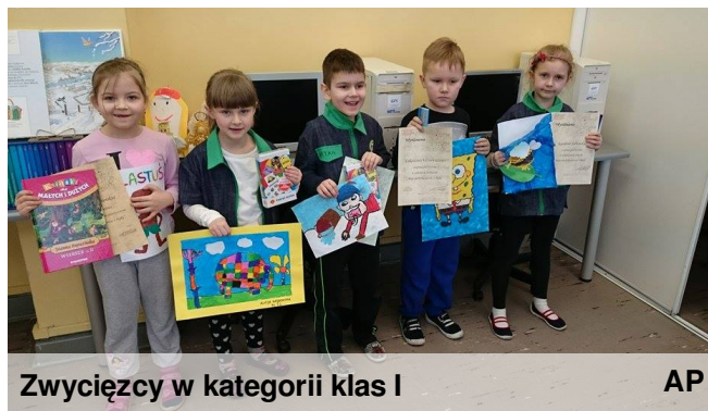
Zwycięzcy w kategorii klas I