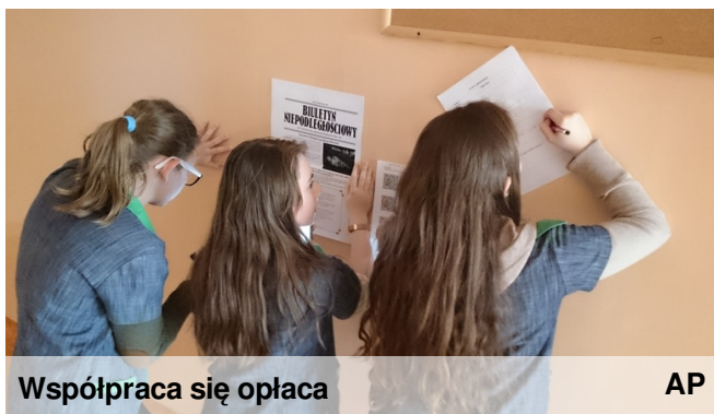
Współpraca się opłaca