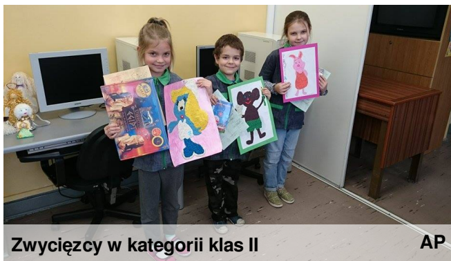
Zwycięzcy w kategorii klas II