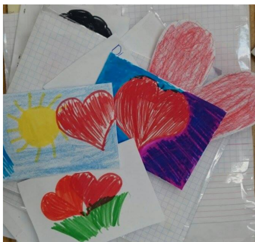
Walentynki 2016 w naszej szkole

26 lutego gościliśmy w naszej szkole uczniów z innych szkół podstawowych w Białymstoku. Wszyscy spotkali się po to, aby poprzez udział w grze międzyszkolnej "Historia miasta nad Białą..." poznać historię Białegostoku. Zwycięzcami gry zostali uczniowie z SP Nr 45 im. Św. Jana Pawła II.