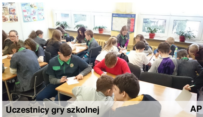
Uczestnicy gry szkolnej