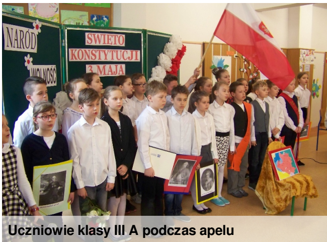
Uczniowie klasy III A podczas apelu

Uczniowie klas III a (pod kierunkiem pani Barbary Zadykowicz) oraz V b (pod kierunkiem pani Izabeli Łuckiewicz) przygotowali w tym roku uroczyste apele z okazji uchwalenia Konstytucji 3 Maja. Pamiętajmy o tym ważnym święcie co roku!