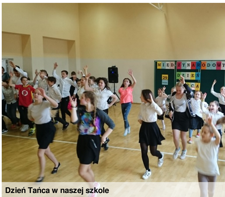
Dzień Tańca w naszej szkole

Konstytucja to najważniejszy akt prawny w państwie. Do konstytucji "dopasowuje się" wszystkie prawa i ustawy. Konstytucja 3 Maja była pierwszą w Europie, a drugą, po amerykańskiej, na świecie. W Polsce w 1791 r. uchwalenie zbioru praw, które regulowały podstawowe problemy społeczno-polityczne oraz organizowały pracę władz państwowych było niezwykle istotne.