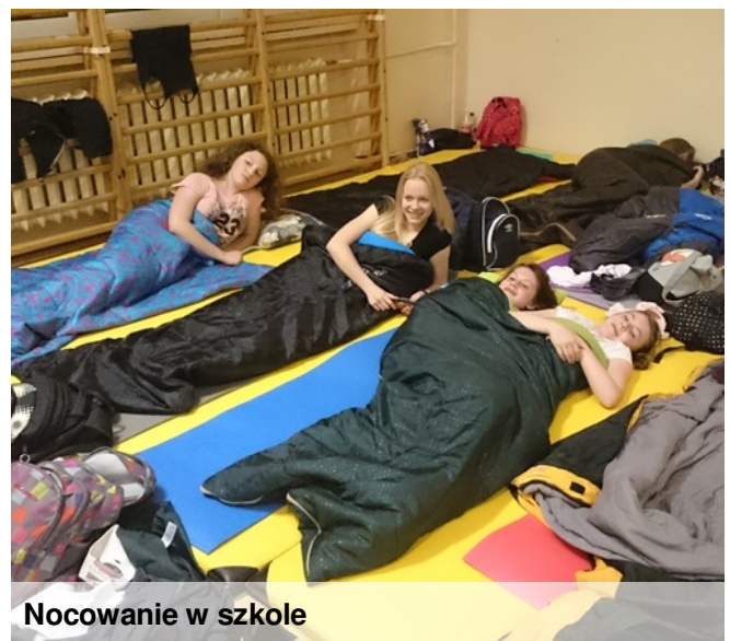
Nocowanie w szkole

W nocy z 13/14 maja szóstoklasiści wzięli udział w nocowaniu w szkole. Zorganizowali dyskotekę, wspólne karaoke, przygotowali kolację oraz wzięli udział w harcerskich grach zespołowych. Wspólne rozmowy nocą - to jest to!