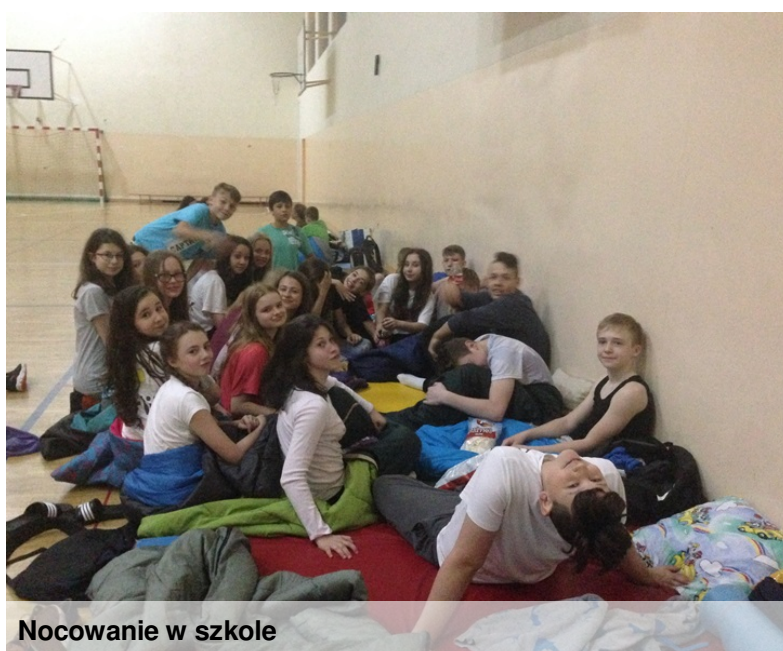
Nocowanie w szkole