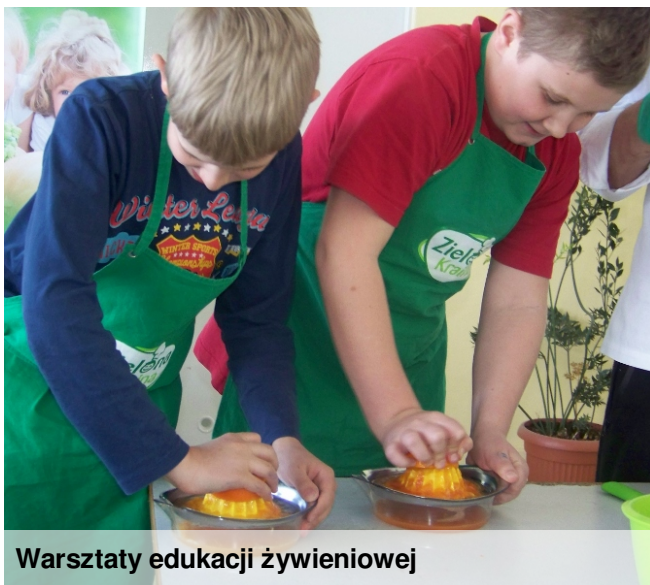
Warsztaty edukacji żywieniowej

W nocy z 13/14 maja szóstoklasiści wzięli udział w nocowaniu w szkole. Zorganizowali dyskotekę, wspólne karaoke, przygotowali kolację oraz wzięli udział w harcerskich grach zespołowych. Wspólne rozmowy nocą - to jest to!