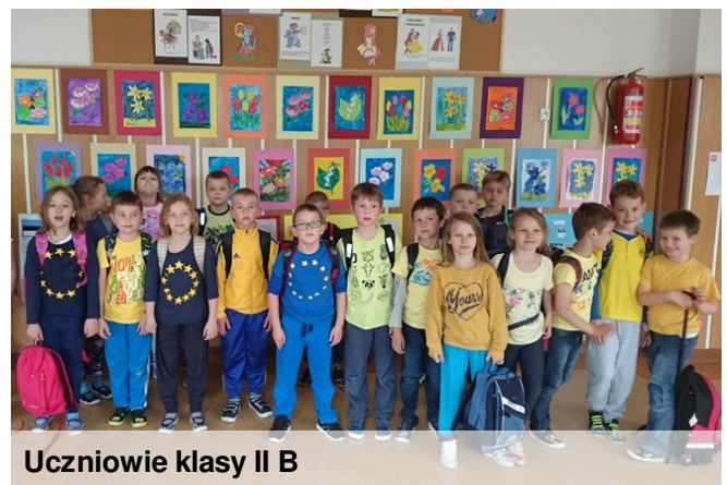
Uczniowie klasy II B

17 maja obchodziliśmy w naszej szkole Dzień Europejski. Wszyscy chętni mogli wziąć udział w quizach i sprawdzić swój stan wiedzy o Europie. W bibliotece szkolnej została przygotowana wystawka okolicznościowa pt. "W podróż po Europie". Wszystkie klasy ozdobiły drzwi swoich sal informacjami o wylosowanym przez siebie państwie europejskim.