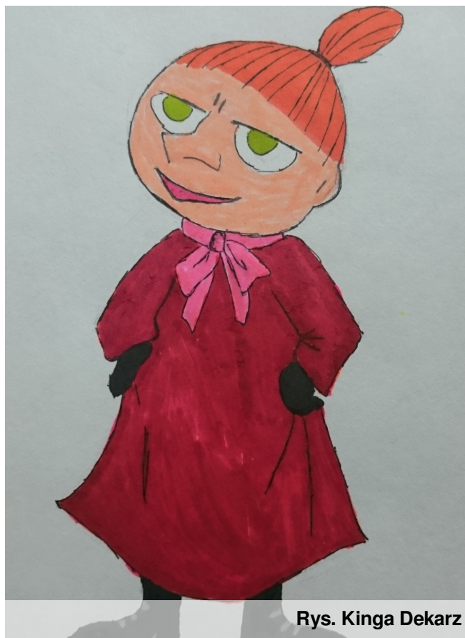
Rys. Kinga Dekarz