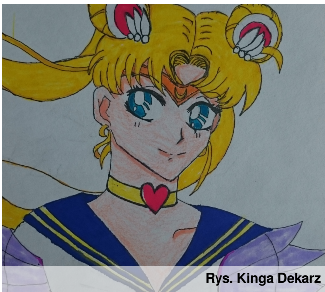
Rys. Kinga Dekarz