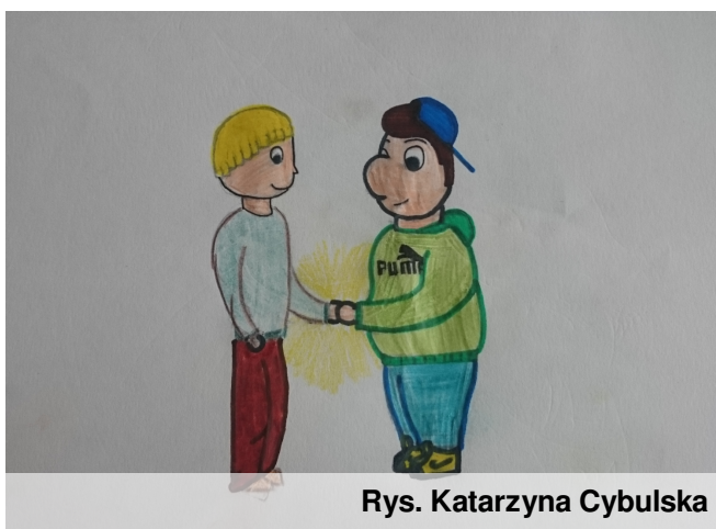
Rys. Katarzyna Cybulska